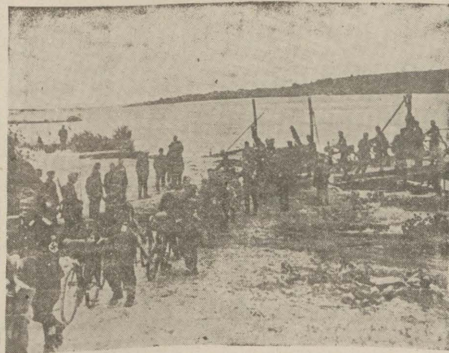
Şark cephesinde bir nehrî geçen Alman birlikleri

Teşekkül edecek Kıyamüssaltana kabinesi, mevcut muahedenin ahkâmını yerine getirecek bir şekilde çalışacaktır.