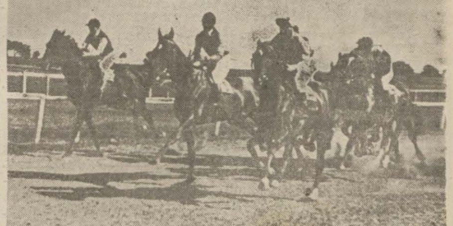
Yarışlardan bir görünüş ve koşuları heyecana takib edenler