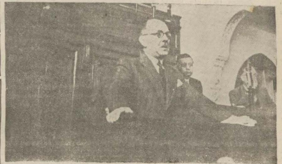
Başvekil Şükrü Saracoğlu Mecliste beyanatta bulunurken

Ankara, 2 (A.A.) — Ticaret Vekili Doktor Behçet Uz, batı Anadolu vilâyetlerinde bir haftadanberi yapmakta olduğu tetkik seyahatin den bu sabah Ankaraya dönmüş ve kendisini beklemekte olan Ankara, İstanbul ve İzmir Ticaret Odaları mümessillerinden müteşekkil heyeti kabul etmiştir.