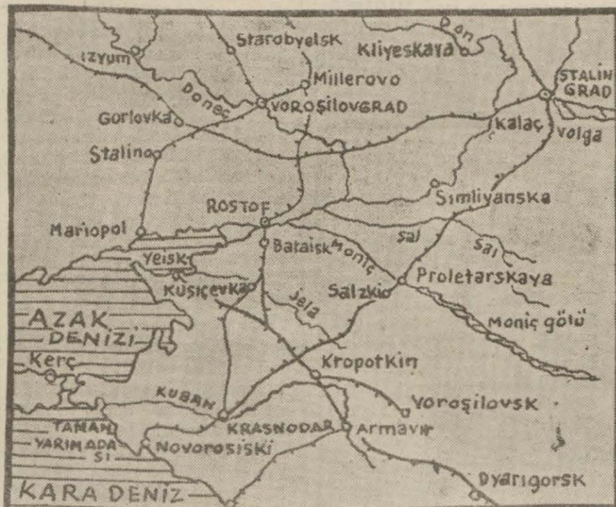
Şark cephesinin cenub kısmını gösteren harita

Japonların bugünkü durgunlukları Rusyaya karşı bir hareket hazırlığı mıdır? Yazan: Emekli General K. D.